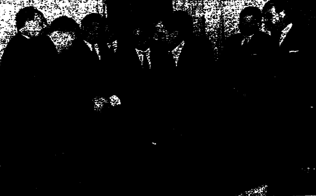
رئاسة اللجنة المالية للتواب وزير التواب وعضو الهيئة الاقتصادية للمغتربين بمقابلة جلالة الملك

قبل الطبع القاهرة - وصل الى هنا أمس وفد عسكري عراقي برئاسة رئيس كلية الأركان العراقية في زيارة للجمهورية العربية المتحدة تستغرق أسبوعاً بيروت - اقلية - غادر السيد محمد احمد محجوب رئيس وزراء السودان الخرطوم بطريق جده وعضو اللجنة العربية الخاصة بإخلاء السلام في اليمن بيروت أمس السيد الخروم بطريق جده وكانت اللجنة الثلاثية المكونة من السودان والمغرب قد انتهت اعمالها يوم الجمعة الماضي بامسارين اعلمت فيه قتلها في اقتصاص الوفدين الجمهوريين والمكي في الاجتماع البقية على صفحة ٦ عمود ٢